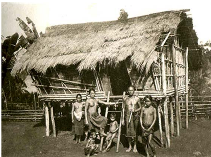
4. Người Xtiêng / The Stiengs