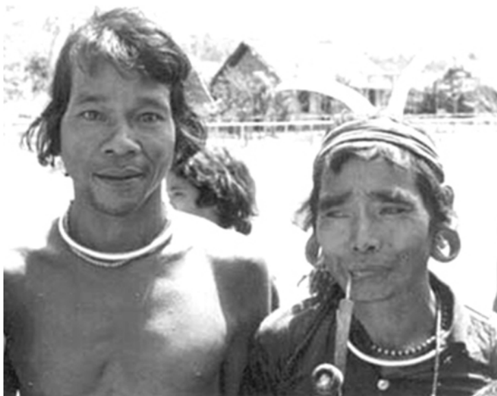
3. Người M'ng / The M'ngs , Sông Bé 1962.