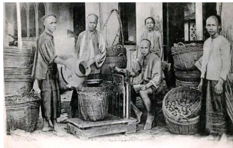
6. Người Hoa / The Chinese , Chợ Lớn 1906