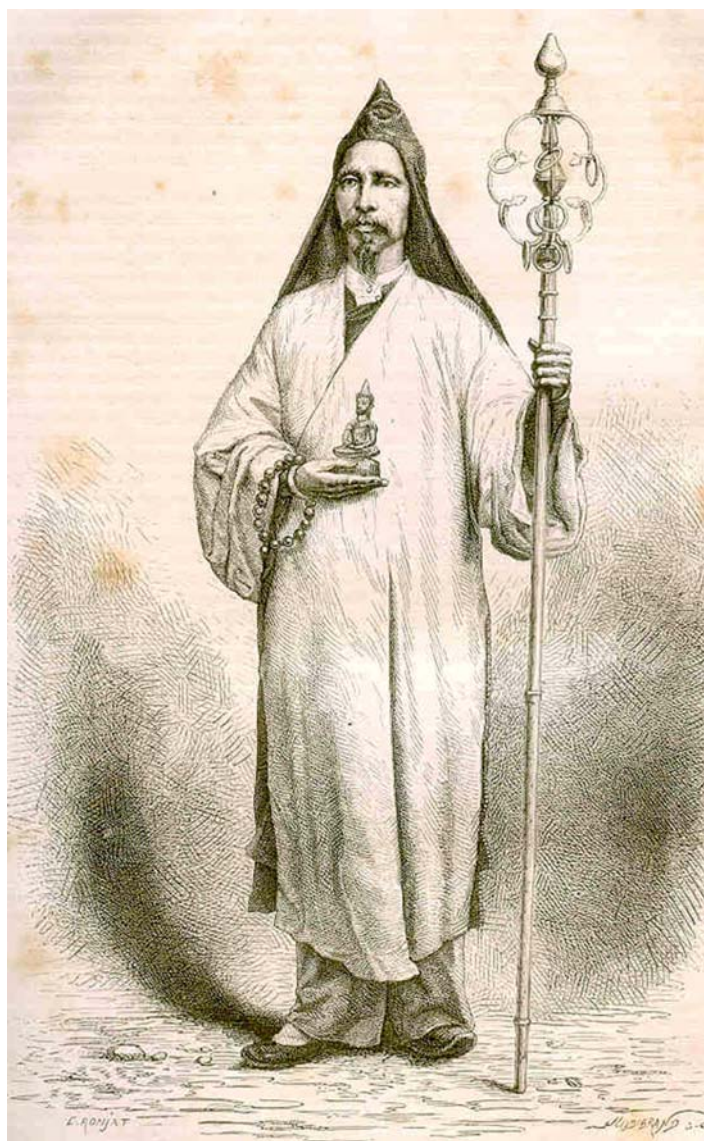
7. Nhà sư ở Nam Kỳ 1872 Buddhist monk, Cochinchina 1872 (Morice, bác sĩ / M.D.)