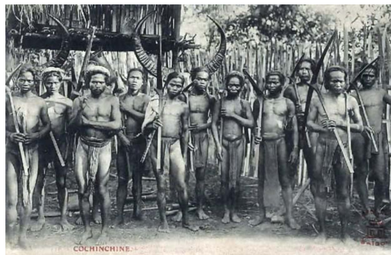
5. Người Mạ / The Mas , Biên Hòa (Đồng Nai) 1920s ( http://hinhxua.free.fr/autrefois/ethnies )