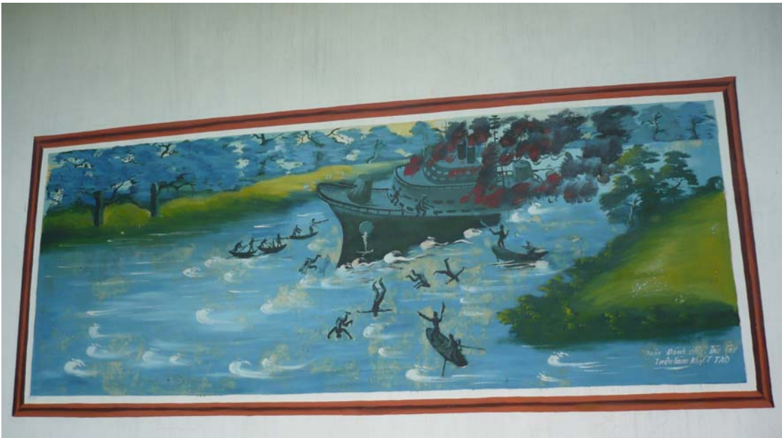
Hình trên: Tranh đánh tàu Espérance (khu du lịch sinh thái Nguyễn Trung Trực, xóm Nghè)