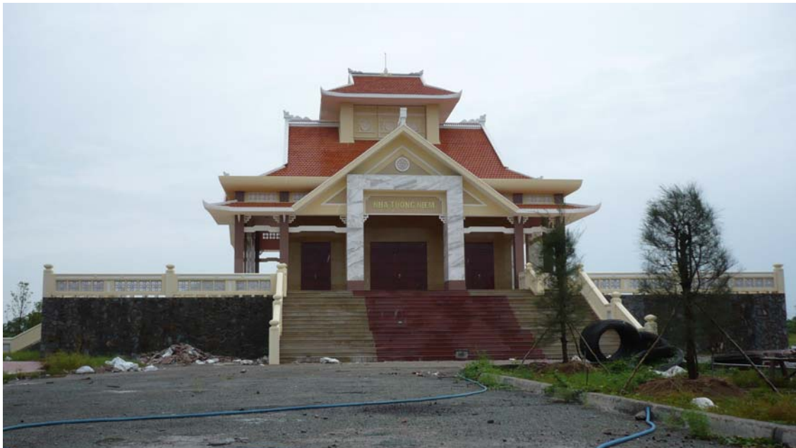
Hình trên: Nhà lưu niệm chiến thắng Nhựt Tảo