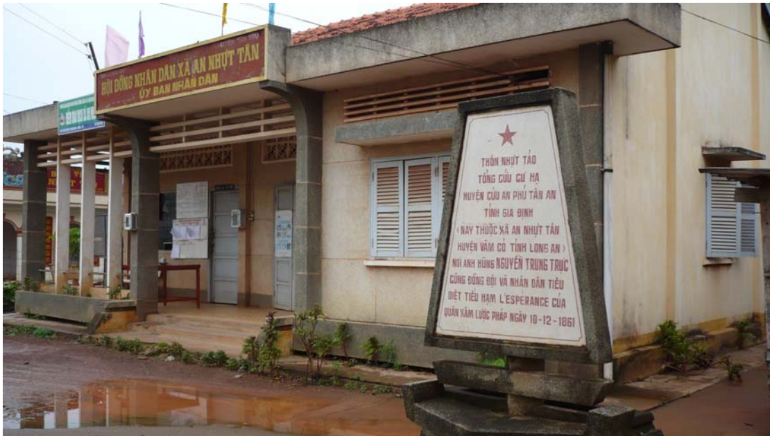
Hình trên: Bia lưu niệm chiến thắng Nhựt Tảo