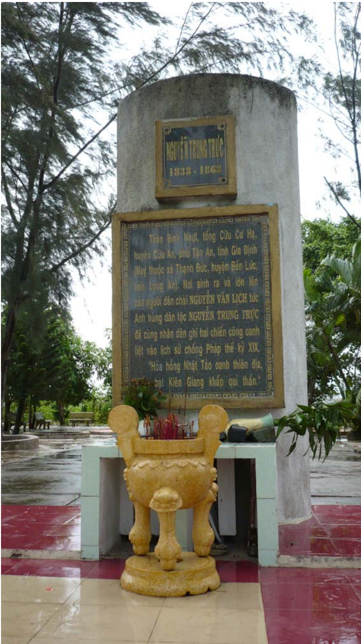
Hình trên: Bia ghi danh tại xóm Nghê