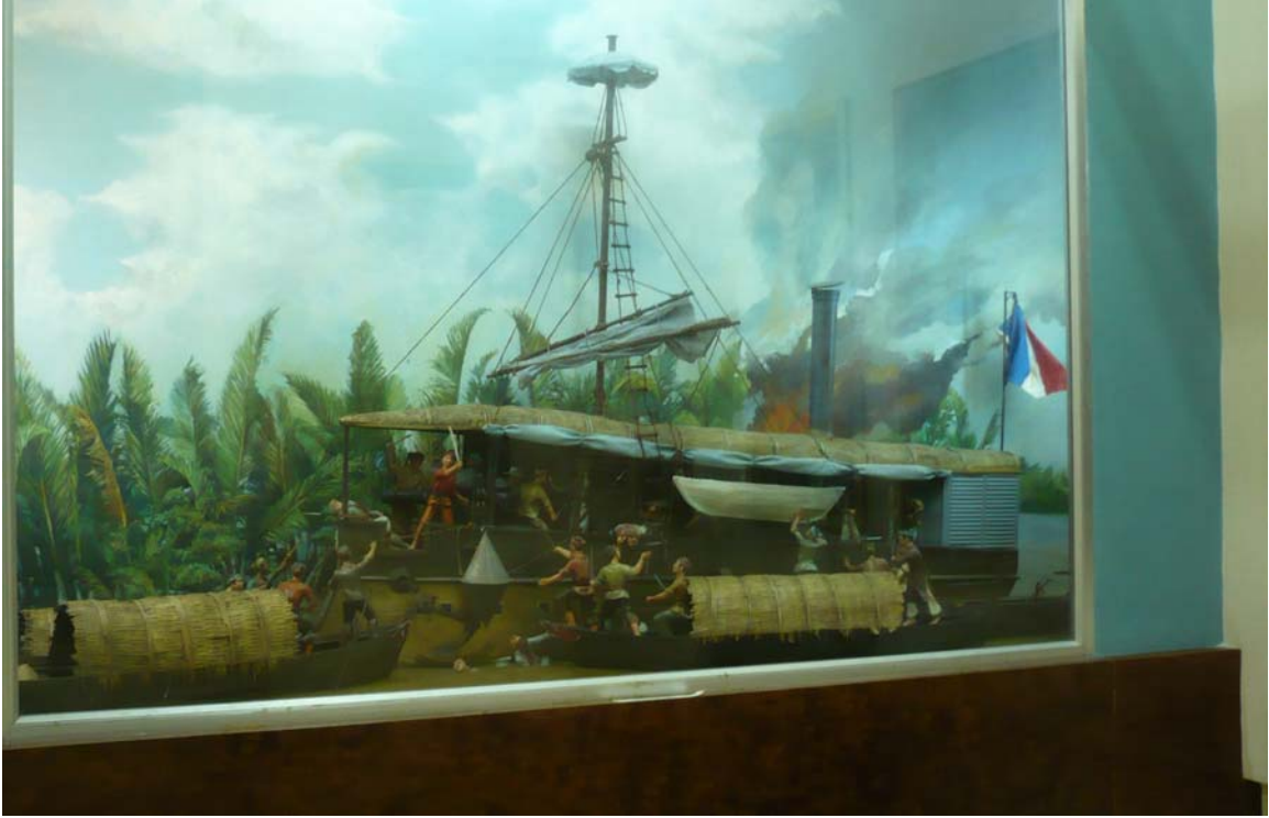
Hình trên: Tranh đánh tàu Espérance (Bảo tàng L.A)