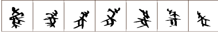
Giáp cốt văn